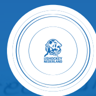
RON BERTELING SCHAAL